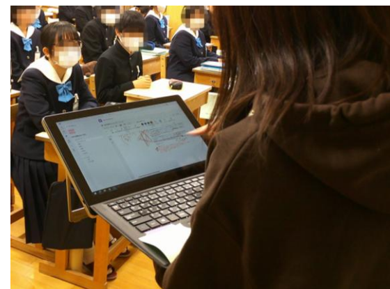
指導者用端末を見ながら 生徒に伝達