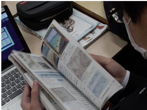
教科書や資料集、 インターネットを使って情報収集

様々な資料を基に日本が開国したことによるメリット・デメリットを調べました。集めた情報を整理し、開国したことが正しい判断だったのかどうかをグループで話し合いました。最後に判断した結果と理由を発表しました。