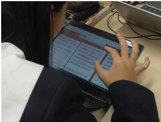
クラウド上の情報を見ながら グループで話し合い