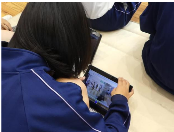
撮影した動画を確認