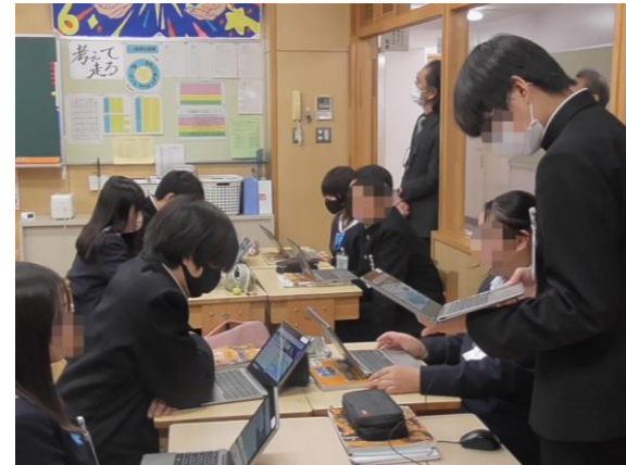
話し合った内容を発表