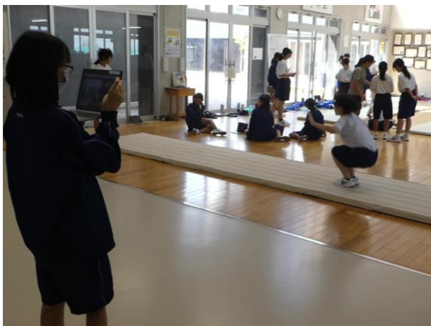
ペアの動きを撮影

1人1台端末のカメラ機能を活用して、互いの動きを撮影しました。撮影した動画を確認したり、気付いたことを伝え合ったりして、修正ポイントを明確にして繰り返し練習しました。