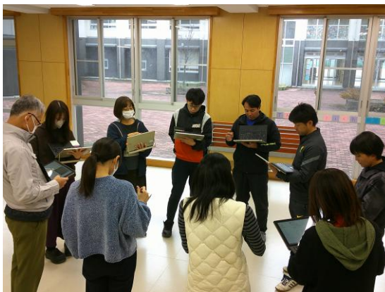
打ち合わせ内容を共有