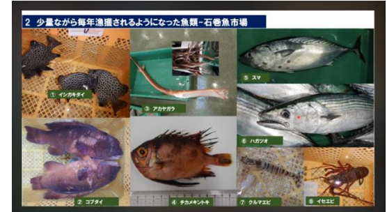
【獲れる魚について興味をもった児童のスライド】

まず、日本で獲れる魚、獲れる場所について全体で共有し水産業についての関心を引き出した。その後、個人で興味のあることを中心に学びを進め、調べていく中で疑問に思うこと、気になることをさらに追及していくようにした。どんな魚がとれるのか気になる児童は詳しく写真を使ってまとめ、サンマがどのようにして私たちのもとに届くのかについて興味がある児童は、そのことを中心にまとめていた。最終的にどんな課題がありどんな工夫をしているのかについて自分の考えや調べたことをまとめ、プレゼン形式で全体共有した。