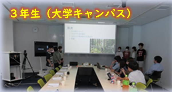
3年生（大学キャンパス）