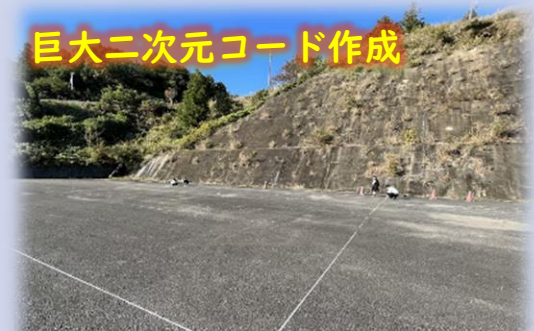
巨大二次元コード作成