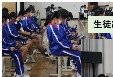
生徒総会（ペーパーレス化）