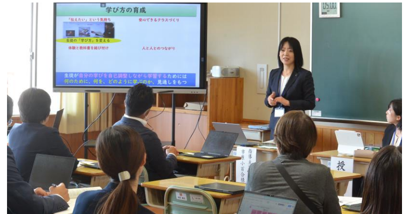
2年英語科 授業研究会