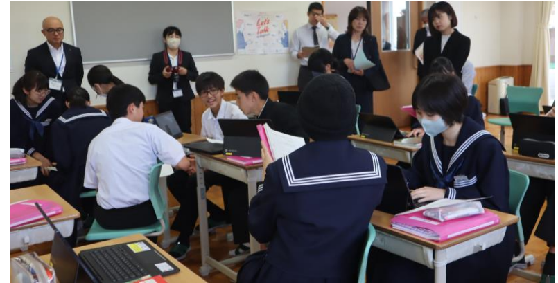
2年英語科 公開授業