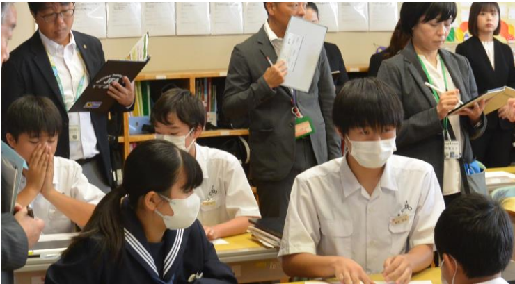
1年数学科 公開授業

10月19日（木）に地域内外の教育関係者に広く呼びかけ、県内外から約250名の参加者があり、山江村小中学校研究発表会を開催した。山江中では1年生数学科、2年生英語科の公開授業を行った。