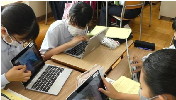
学級で集めた情報をグループで発表

テーマの中からプロジェクトを立ち上げるために、1人1台端末のデジタルホワイトボードソフトを使って、学級で集めた情報（テーマごとの課題）を学年で共有し、グルーピングやラベリングをしながら課題を広げました。