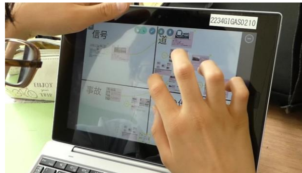
発表をもとにグルーピング