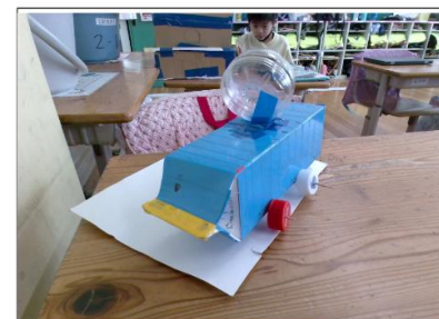
パワーアップしたおもちゃ