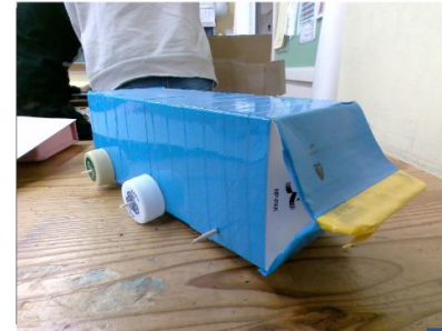
かんせいしたおもちゃ