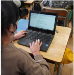
第1回校内授業研究会