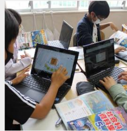
第2回校内授業研究会