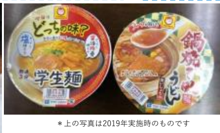
*上の写真は2019年実施時のものです