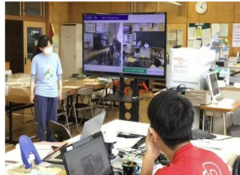
ICT機器を活用しての事例紹介