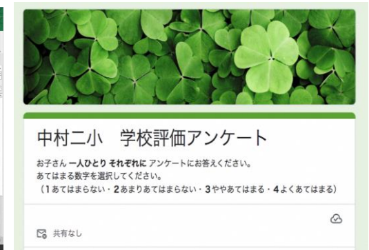
Google フォームで学校評価アンケートを実施