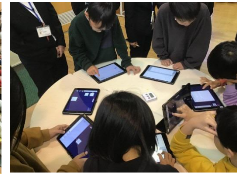
習熟度別による適用問題づくり