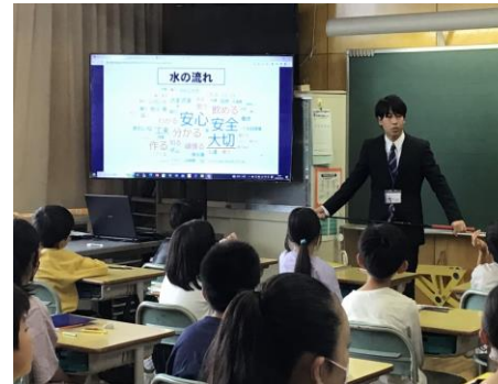
ワードクラウドを表示