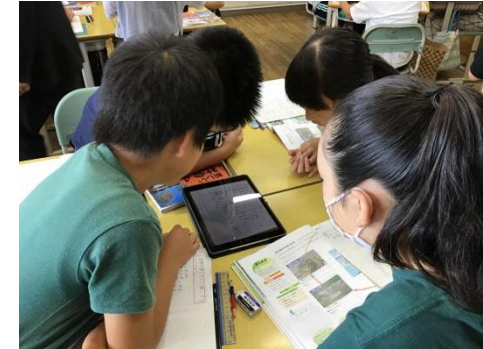
それぞれの考えの視覚化と共有