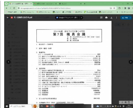
Google Drive上の職員会議要項