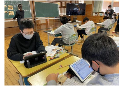
アプリを活用した問題づくり