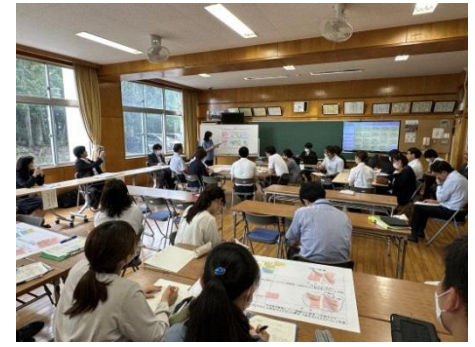
事後研究会におけるICTの活用