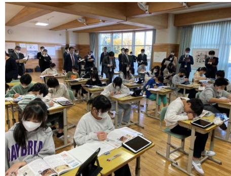
個に応じた学習ツールのタブレット