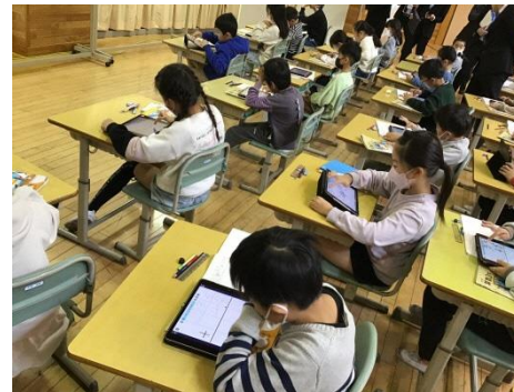
解説動画等による奇襲事項のふり返り

○習熟度別の問題を解く活動において、クラウド型学習支援ソフトによって適用問題づくりをする。