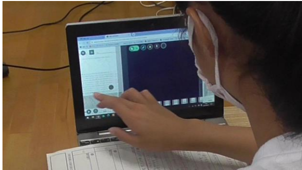
自分の進度に合わせて問題を選択

5年 算数科「合同な図形」＜プロジェクト型学習の要素を効果的に取り入れた教科学習＞ 1人1台端末を使って、自分に合った方法で、自分のペースで、必要に応じて考えを交流しながら、三角形の内角の和をもとに、四角形や五角形などの多角形の内角の和を求めました。