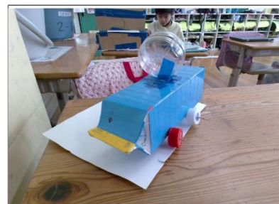
パワーアップしたおもちゃ