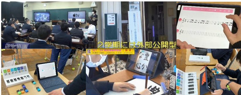
ICT・DX研究推進研修会(R5.12/8)の開催と、オンデマンド配信による成果波及

今後はさらに、「主体的・対話的で深い学び」と、より効果的・効率的な学校教育活動に資する研究開発を続けながら、明るい未来を担う子どもたちを育てていきます。