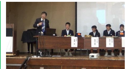
「くみちゅう キャリアフェスティバル 2023」