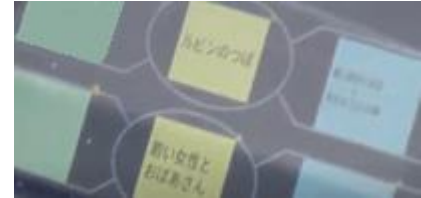
シンキングツールを用いた深い学び(国語)

一部の生徒の発言のみで授業が進むこともなく、抵抗感を払拭できた生徒も数多くいます。これらを授業の特別な山場で使用するのではなく、「 普段使い 」として常用することができれば、実際の発言や発表と組み合わせ、多面的な授業展開が可能となります。