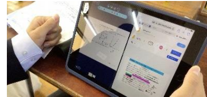
↑ ↓ 複数画面・アプリの併用(演習とヒントの提示)