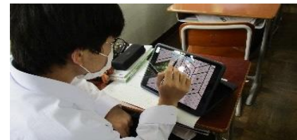
↑ ↓ 教科書や資料とアプリの併用