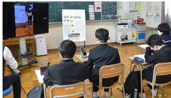
動画で発表の様子を振り返り