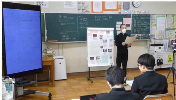
発表原稿を映し出して発表

学級全体で取り組んだプロジェクトについて学んだことを撮影しながら学級内で発表し合いました。その動画から発表の様子を振り返り、本番の発表までに伸ばすとよいことや直すところを確認し合いました。