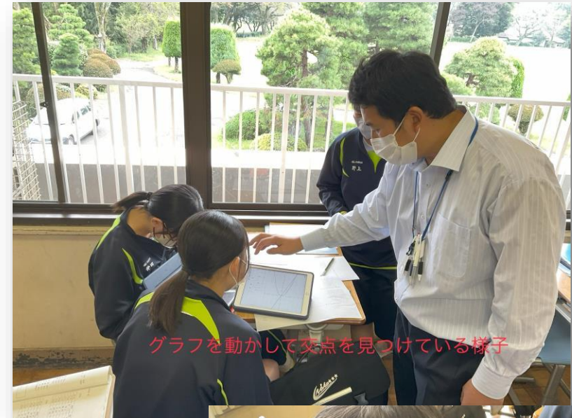
グラフを動かして交点を見つけている様子