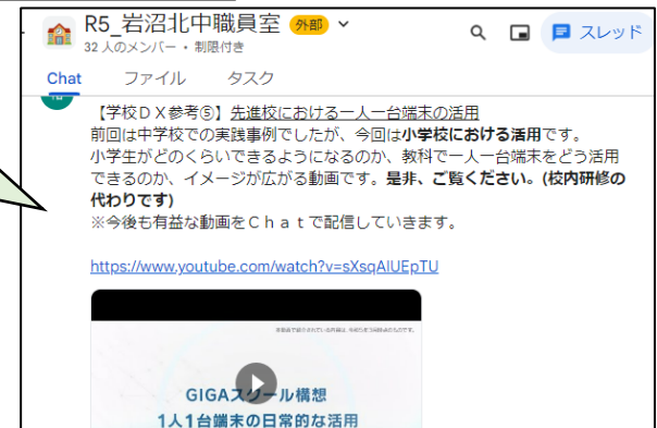
月に1～2回程度の配信