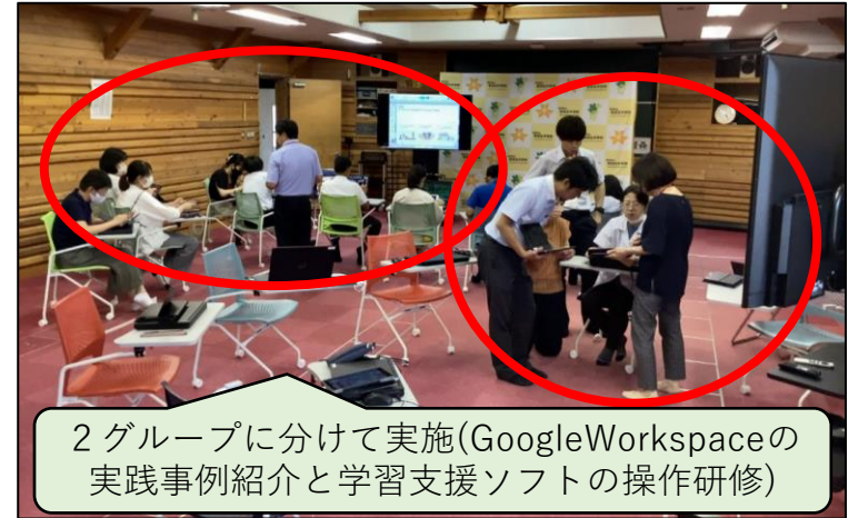
2グループに分けて実施(GoogleWorkspaceの実践事例紹介と学習支援ソフトの操作研修)