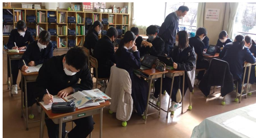
生徒が学習過程や学習形態を自己決定、自己調整する様子