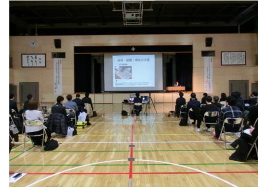
【当日の会場の様子】