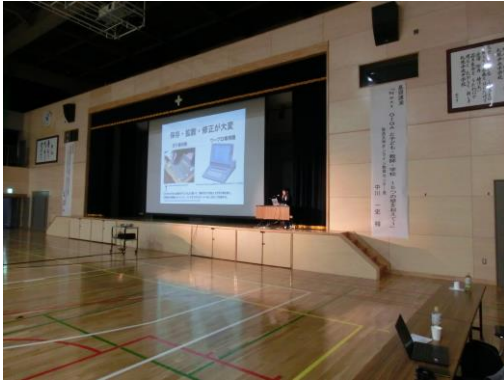
【放送大学 中川一史教授 講演風景】