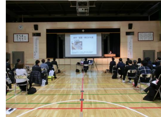
【当日の会場の様子】