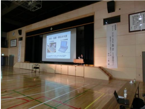
【放送大学 中川一史教授 講演風景】