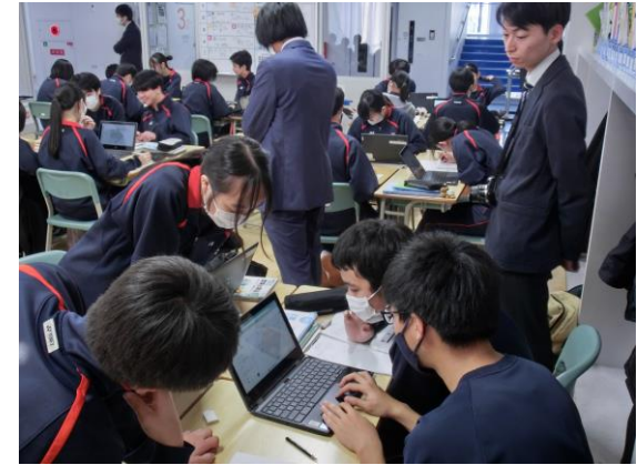
【本校の授業風景を参観する 剣淵町立小中高等学校の教師及び、教育委員会の方々】