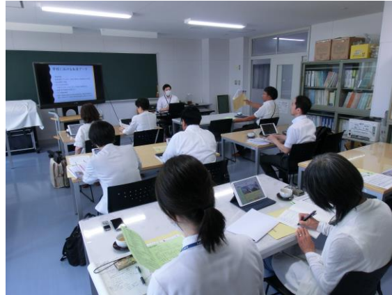
【本校の実践内容を聴く逗子市市議会議員の方々】

また、逗子市、剣淵町、石狩市などから視察依頼を受け、本校の実践を広く紹介する機会を得ている。