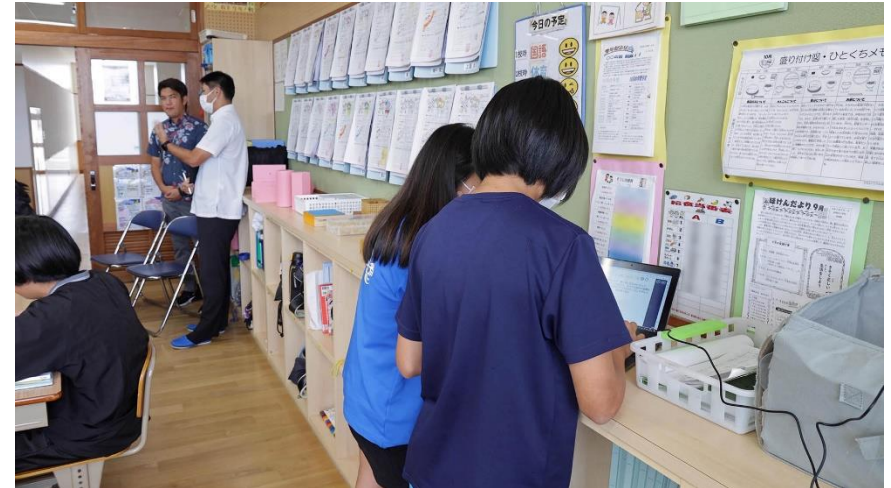
授業開始前に予習内容を確認しあう児童の姿も見られる