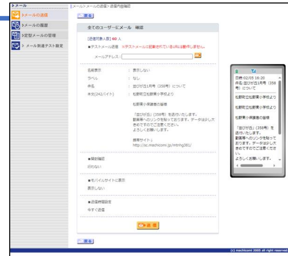
&lt;学校向け連絡網サービス操作画面&gt;