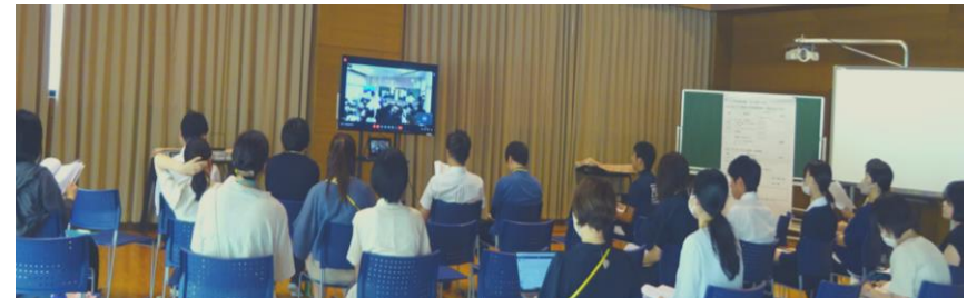
金生第一小学校とのオンラインでの合同校内研修会