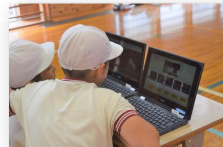
体育科のマット運動

ICT支援員の協力を得ながら、教科を問わず、日常的な活用を進め、実践を共有することで、よりよい取組にブラッシュアップしていこうとしています。