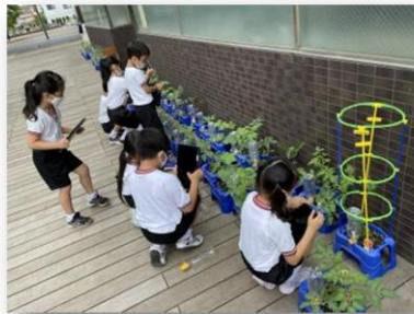
生活科の観察記録

子どものニーズに応じた個別最適な学びを進め、個々の自己肯定感を高めるとともに、様々な選択を可能にした多様な表現を用いて協働的な学びを取り入れ、個別最適で協働的な学びを一体的に進める授業改善を行っています。