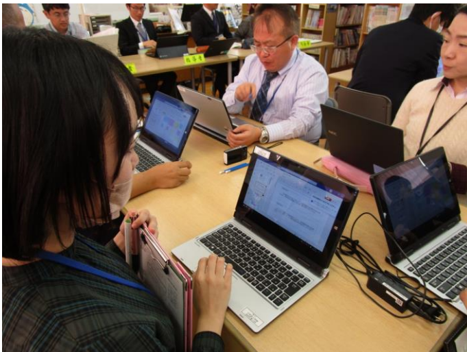
&lt;データを共有しての意見交流（グループ）&gt;