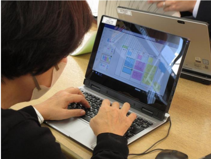
&lt;授業に対する意見入力（個人）&gt;