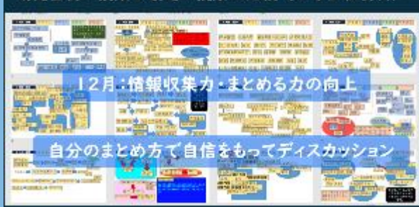
研究当初の授業と最近の授業の比較（6年生社会科）