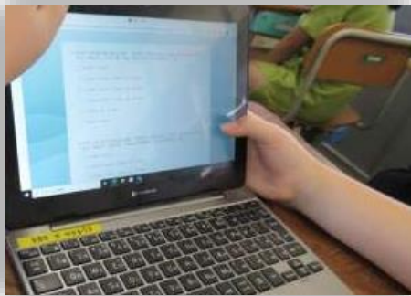
Formsを利用したアンケートの様子

スマートフォンやコンピュータのつかいかたについていえの人とやくそくしたことをまもっていますか。