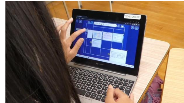
メモしたことを基に共同編集