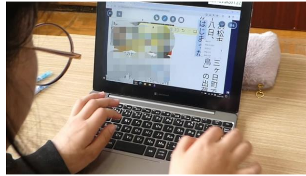
マーキングを基に要約