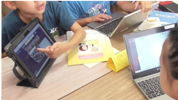
店で働く人の工夫をグループ内で発表

3年 社会科「店ではたらく人」＜プロジェクト型学習の要素を効果的に取り入れた教科学習＞ 探究活動で分かったことを1人1台端末のデジタルホワイトボードソフトを使って表現しました。また、聞き手の意見を基に資料を修正しました。