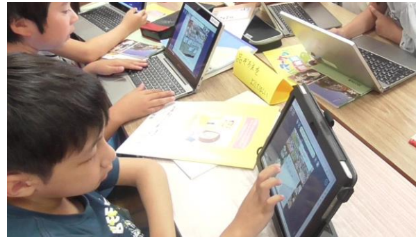
友達の意見を基に資料を修正