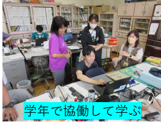
学年で協働して学ぶ