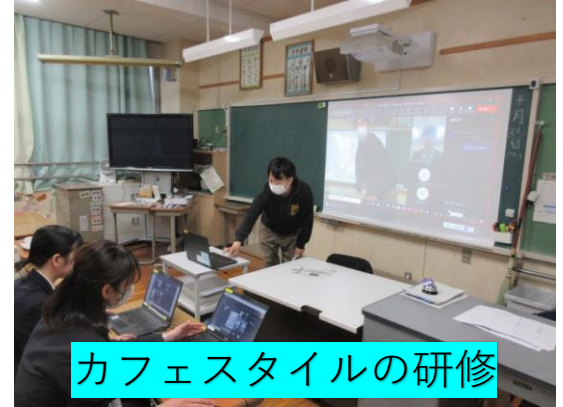
カフェスタイルの研修