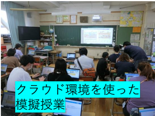
クラウド環境を使った 模擬授業