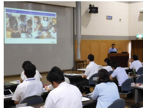
地区別研修会における発表の様子

○Microsoft PowerPoint を活用して、実践事例の内容をより分かりやすく説明する。