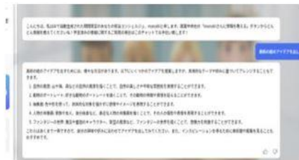
(例) 美術のイラストのアイデア出し