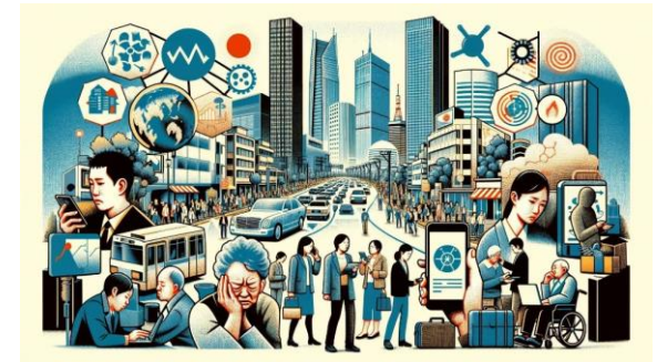
「現代日本社会の課題」から生成された絵

【概要】 ○キーワード「現代日本社会の課題」を描画するよう生成AIに指示すると、右のような図が生成される。 ○ここから、生徒は図に書かれているものから、「デジタルデバインド」「高齢化社会」「都市部の混雑」など、推測される課題を列挙し、ここからストーリーを作成することで、 課題のアイデアが出やすくなる ことを体験した。