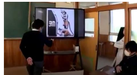
研究授業動画あり https://youtu.be/-O2m7T7_xG0