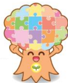
新小倉小マスコットキャラクター 「フューちゃん」