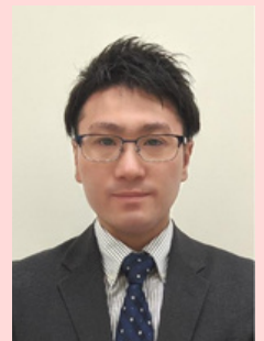
宮城教育大学教育学部 准教授