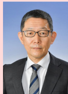
宮城教育大学教職大学院 特任教授