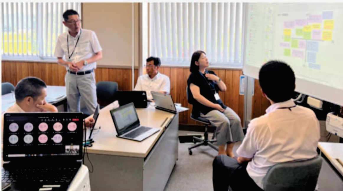
学校DX戦略アドバイザーの先生を招いて行った研修会の様子